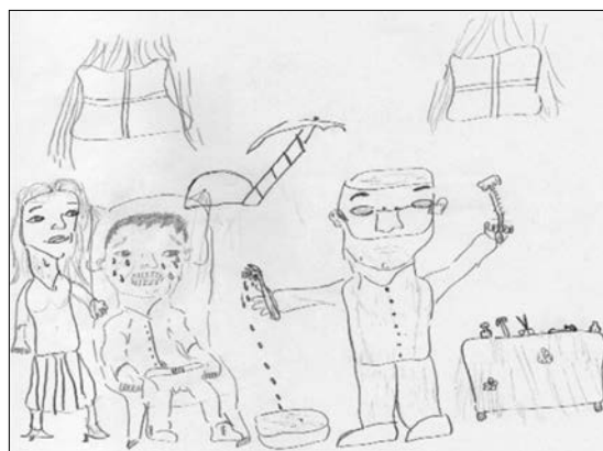
Figura 2 – Impressão geral do desenho negativa. Patos, PB, 2017.

Na figura 2, observamos que foi dada ênfase ao instrumental e a criança apresenta uma fisionomia de medo e dor, agressividade e antipatia, representando uma impressão negativa da criança em relação ao dentista e ambiente odontológico.