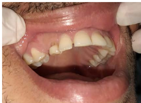
Figura 1 – Exame intra-oral. Verificou-se ausência dos dentes 13 e 14 e presença do dente 54.

Paciente, 27 anos, ASA 1, leucoderma, compareceu à clínica buscando avaliação de rotina. No exame intraoral verificou-se ausência dos dentes 13 e 14, além da retenção prolongada do dente 54 (Figura 1). Foi solicitada uma radiografia panorâmica com a finalidade de averiguar esta ausência. Ao analisar, foi observada a presença de uma lesão radiopaca sugestiva de odontoma complexo e impaction dos dentes 13 e 14 (Figura 2).