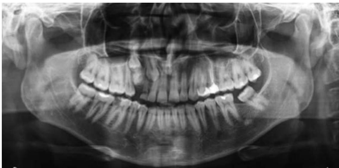
Figura 2 – Observada presença de uma lesão radiopaca sugestiva de odontoma complexo, além de impaction do dente.